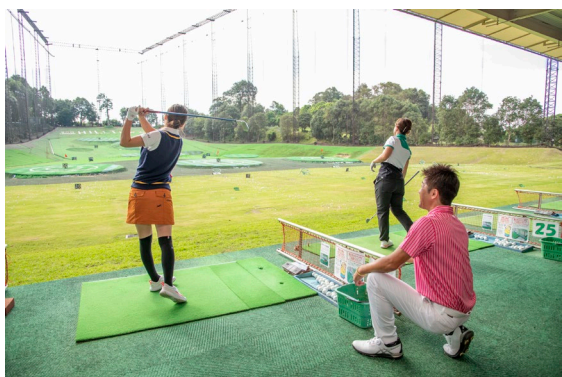
女性ワンポイントレッスン会（参考写真）