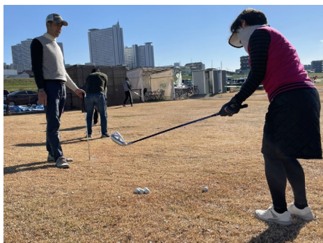
女性アプローチワンポイントレッスン会（参考写真）